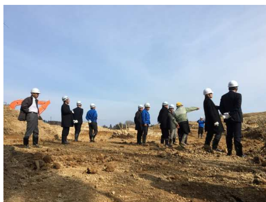
建設予定地の様子