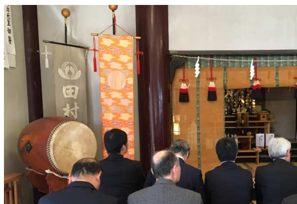
安全祈願祭の様子