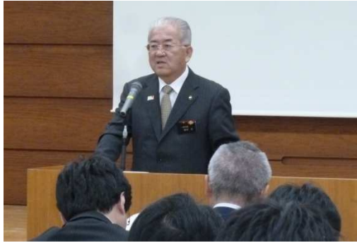
一関市勝部修市長による説明会でのスピーチ