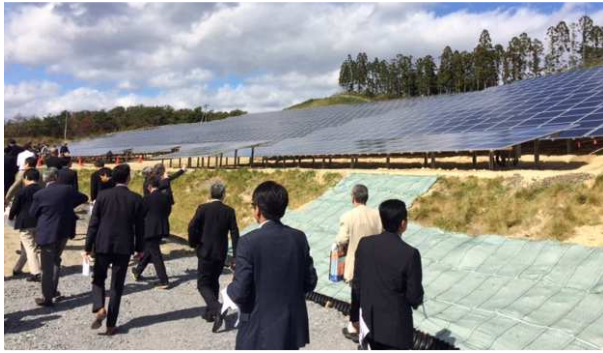
メガソーラー発電所開発現場の視察の様子