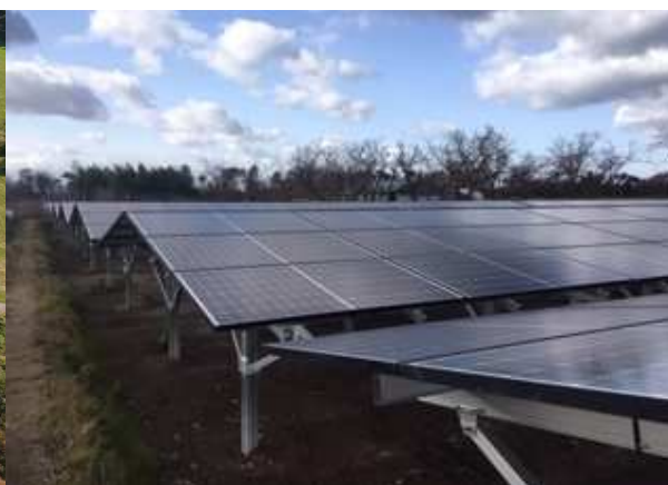
山折り形に配置したパネル