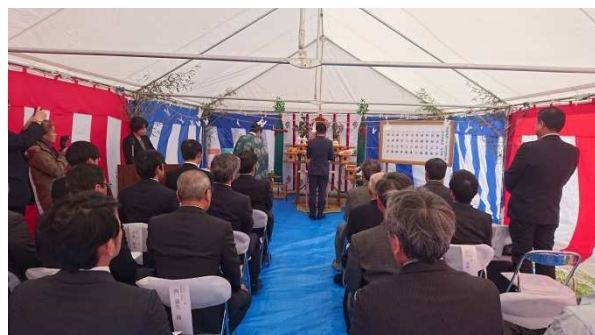
安全祈願祭の様子