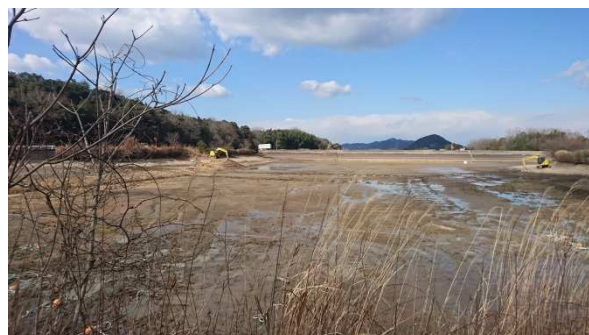
建設予定の御田神辺池