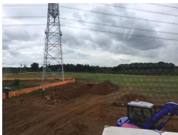
建設予定地の様子

当社は、売電収入を源泉とする安定収益獲得のために平成 30 年 3 月までに 100MW 規模のメガソーラープロジェクトでの売電開始を目指してまいりました。その結果、平成 28 年 7 月末現在において、投資をしたプロジェクトは企画中の案件も含め合計 26 件 103.0MW まで拡大しました。